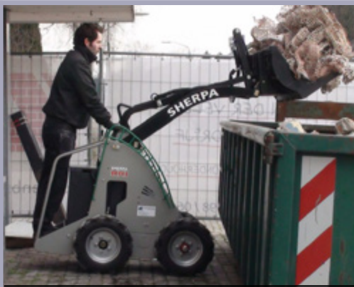
כלים ברוחב החלל מ-76 ס"מ, החל ממחשקל 530 ק"ג