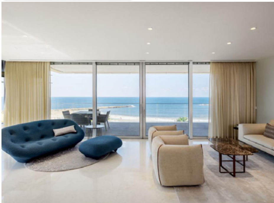
עיצוב שבי מזרחי.