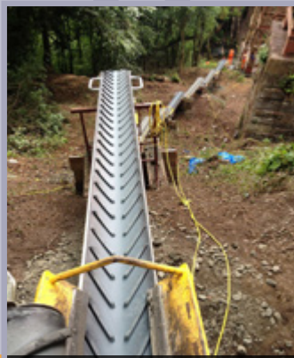
השכרה ומכירה של מסועים לפינוי פסולת והכנסה של חומרים