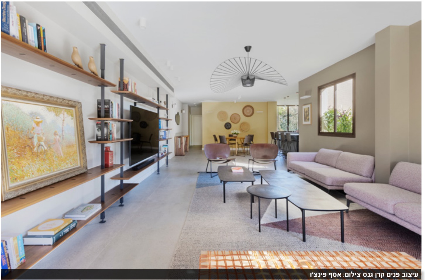
עיצוב פנים קרן גנס