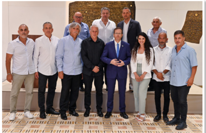
לאחר המפגש ההיסטורי, מאמינים שנשיא המדינה ימשיך לתמוך בענף ובהתאחדות. צילום: אמיר לוי שרותי צילום

צילום השער: הצילום מועדת הכנסת: צילום מסך